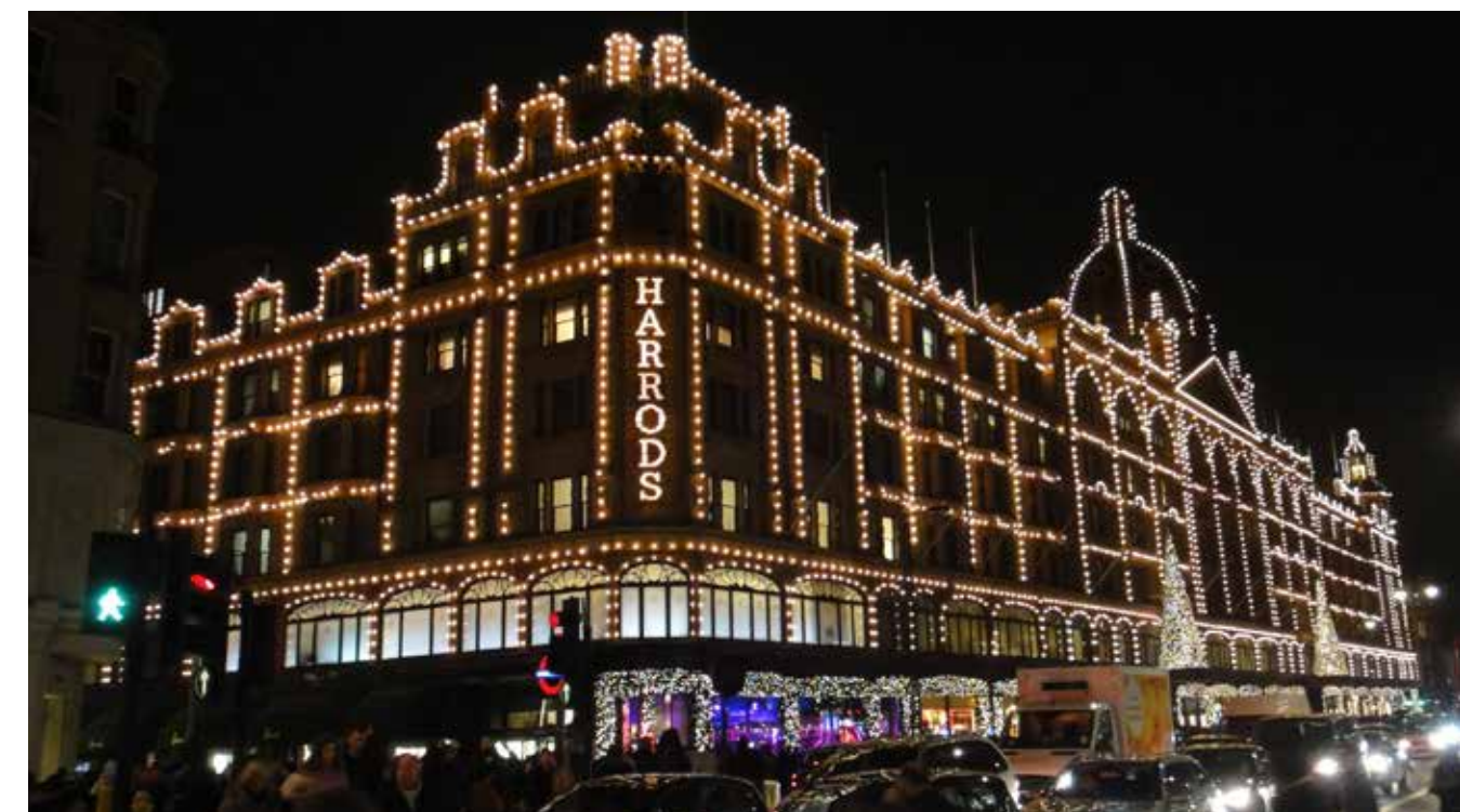
Una vista esterna di Harrods lungo Knightsbridge, i grandi magazzini londinesi famosi in tutto il mondo.

7 x 46" X464UNS Video wall displays at Door 10 located on a number of floors replacing legacy NEC displays 24 x 32" V321 Signage displays on the Egyptian Escalator 16 x 40" P403 Signage displays located within Shoe Heaven