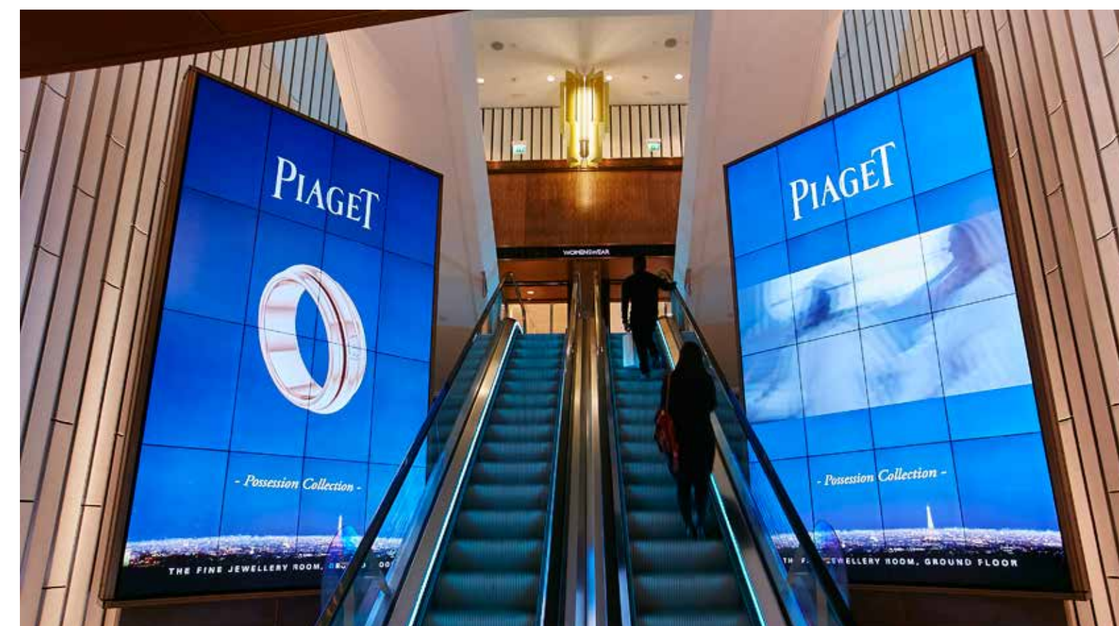
Due splendidi videowall, ciascuno formato da 16 pannelli NEC da 46", sono stati posizionati al piano terra ai lati delle scale mobili.