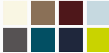
Auswahl diverser Farben